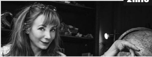
Sur un chantier abandonné, une découverte macabre ébranle la tranquillité de la ville : une main de femme émerge d'une dalle de béton.