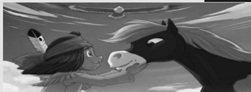
Yakari, un jeune indien sioux qui rêve de grands espaces, parcourt les plaines autour de son village avec son fidèle chien Oreille tombante.

france•2 Règne animal, les jeux de l'amour