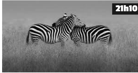
Des forêts profondes aux déserts les plus arides, des terres arctiques aux prairies des campagnes, les femelles rivalisent d'ingéniosité pour trouver le partenaire idéal et donner la vie. Elles doivent choisir le meilleur père pour assurer la survie de leurs petits.

france•2 Règne animal, les jeux de l'amour