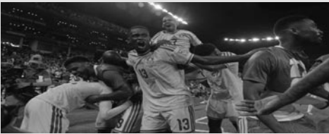
Football. Coupe du monde. 16e de finale.