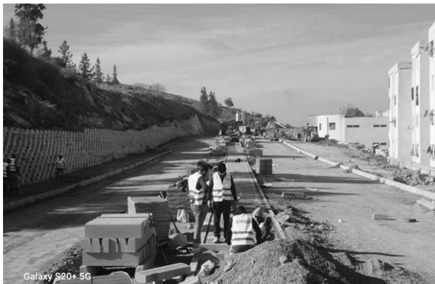
Galaxy S20+ 5G

Les travaux de réalisation et d'aménagement de plusieurs projets de développement ont été lancés, dans la commune de Saïda. Ces projets visent à consolider le cadre de vie des citoyens ainsi qu'à renforcer les infrastructures et les services de base, a-t-on appris, dimanche, auprès des services de la wilaya. Ces projets comprennent la mise en place d'une nouvelle couche d'asphalte sur la route reliant la Maison de jeunes Abane-Ramdane au marché des fruits et légumes de Hai Zitoune. Cette opération permettra d'améliorer la circulation routière, de faciliter les déplacements des citoyens et de mieux relier plusieurs quartiers entre eux, selon la même source. Les travaux de réalisation d'une passerelle au-dessus de l'oued