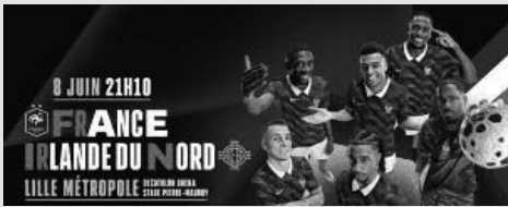
Football. Match amical international. Match de préparation à la Coupe du monde.