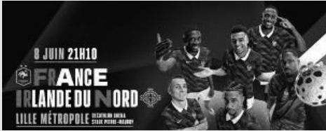
Football. Match amical international. Match de préparation à la Coupe du monde.