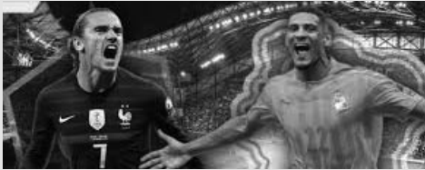
Football. Match amical international. Match de préparation.