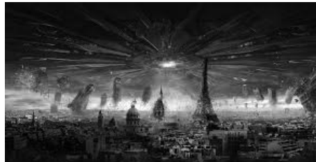
Vingt ans après la tentative d'invasion extraterrestre qui a failli anéantir la Terre, l'humanité s'est relevée et a su tirer des leçons de cette expérience traumatisante.

Pour Steven Spielberg : l'IA doit servir d'outil et ne pas se substituer à la créativité humaine