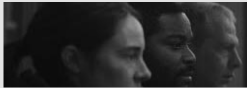
Alors que Baltimore s'apprête à célébrer le passage à la nouvelle année sous un ciel constellé de feux d'artifice, une ombre rôde dans l'obscurité, prête à transformer la liesse collective en cauchemar.

TMC To Catch a Killer : Misanthrope 21h10