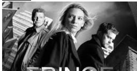
Walter Bishop découvre avec inquiétude que ces phénomènes cataclysmiques sont liés à une machine qu'il a lui-même activée, mettant en péril non seulement notre dimension, mais également un univers parallèle.

Quotidien National d'Information Edité par la SARL NATION EDITION Capital social de 100 000,00 DA