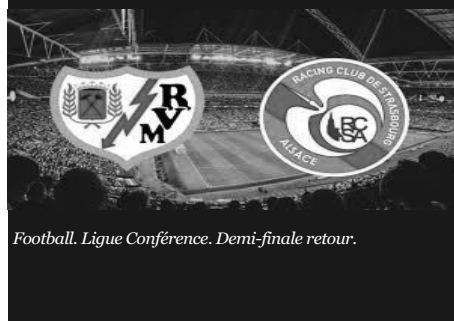
Football. Ligue Conférence. Demi-finale retour.

CANAL+ Strasbourg / Rayo Vallecano 21h00