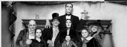
Dans son sinistre manoir, Morticia Addams vient d'accoucher d'un garçon. Si cette naissance emplit de joie son époux, elle ne réjouit guère Mercredi et Pugsley, les deux aînés du couple.

NEVO 19 Les valeurs de la famille Addams 21h10