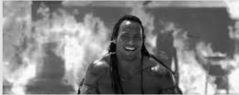
Londres, 1933. Après leurs aventures mouvementées en Égypte, Rick O'Connell et Evelyn Carnahan ont enfin trouvé une vie paisible, loin des malédictions pharaoniques et des créatures surnaturelles.