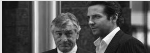
À New York, où les rêves se heurtent souvent à une réalité impitoyable, Eddie Morra est comme une ombre parmi les ambitieux.

NEVO 19 Les valeurs de la famille Addams 21h10