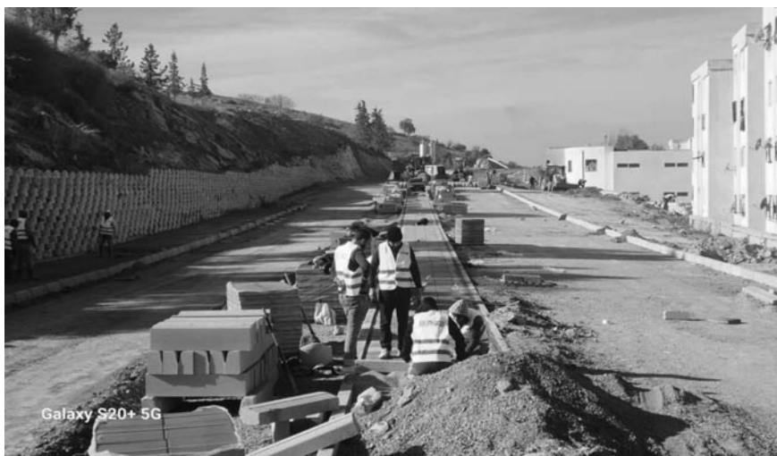
Galaxy S20+ 5G

La réalisation de nombreux projets de développement se poursuit à travers plusieurs secteurs dans la wilaya de Saïda, visant à améliorer le cadre de vie des habitants, a-t-on appris, lundi, auprès des services de la wilaya.