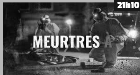
Alors que des meurtres inexplicables secouent une communauté, les enquêteurs, dont la détermination est mise à l'épreuve, doivent plonger dans les sombres archives de l'histoire locale pour découvrir la vérité.