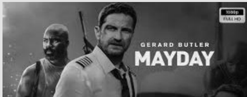
Le pilote Brodie Torrance sauve des passagers d'un coup de foudre en effectuant un atterrissage risqué sur une île déchirée par la guerre seulement pour découvrir que survivre à l'atterrissage n'était que le début.

T18 Ce soir, je vais tuer l'assassin de mon fils 20h55