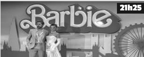
Dans un univers parallèle appelé La Land, où les poupées Barbie vivent dans une utopie éclatante, la perfection semble être la norme.