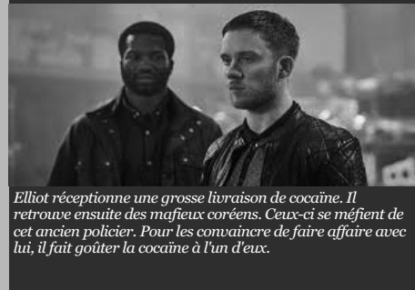
Elliot réceptionne une grosse livraison de cocaïne. Il retrouve ensuite des mafieux coréens. Ceux-ci se méfient de cet ancien policier. Pour les convaincre de faire affaire avec lui, il fait goûter la cocaïne à l'un d'eux.