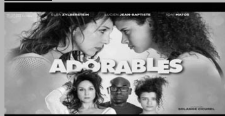
Emma, psychologue réputée pour son franc-parler et son approche novatrice des relations parents-enfants, fait sensation après la publication de son livre à succès, Adorables.

Steven Spielberg admet que Tom Cruise le surpassait sur ses propres tournages