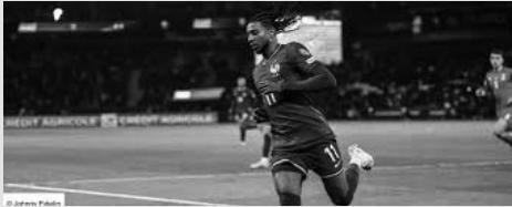
Football : Match amical international