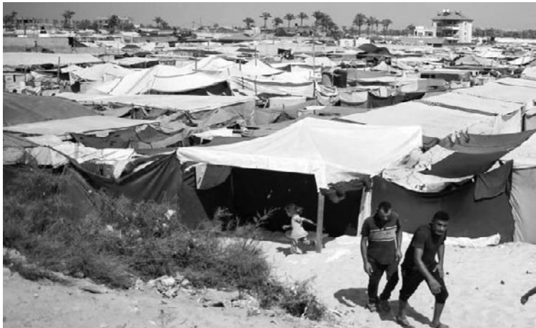
Gaza, deux mois après le cessez-le-feu.

Le manque de ressources, exacerbé par les restrictions de l'armée sioniste sur l'entrée de matériel médical, d'équipements et de médicaments, complique la situation. Par ailleurs, des témoins ont rapporté que des milliers de tentes de déplacés ont été inondées ou emportées par les vents violents. Des milliers de Palestiniens se sont réveillés à l'aube pour trouver leurs abris submergés ou leurs biens dispersés. Des centaines de personnes ont cherché refuge sous les vestiges de bâtiments détruits par l'armée d'occupation sioniste. Le porte-parole de la Défense civile à Gaza, Mahmoud Basal, a alerté sur le risque d'effondrement imminent de milliers de maisons partiellement détruites par les attaques sionistes, sous l'effet des pluies et vents. "Ces bâtiments représentent un grave danger pour la vie de centaines de milliers de Palestiniens sans abri. Nous avons averti le monde à plusieurs reprises, sans résultat", a-t-il déclaré. Cette tempête aggrave la crise humanitaire dans la bande de