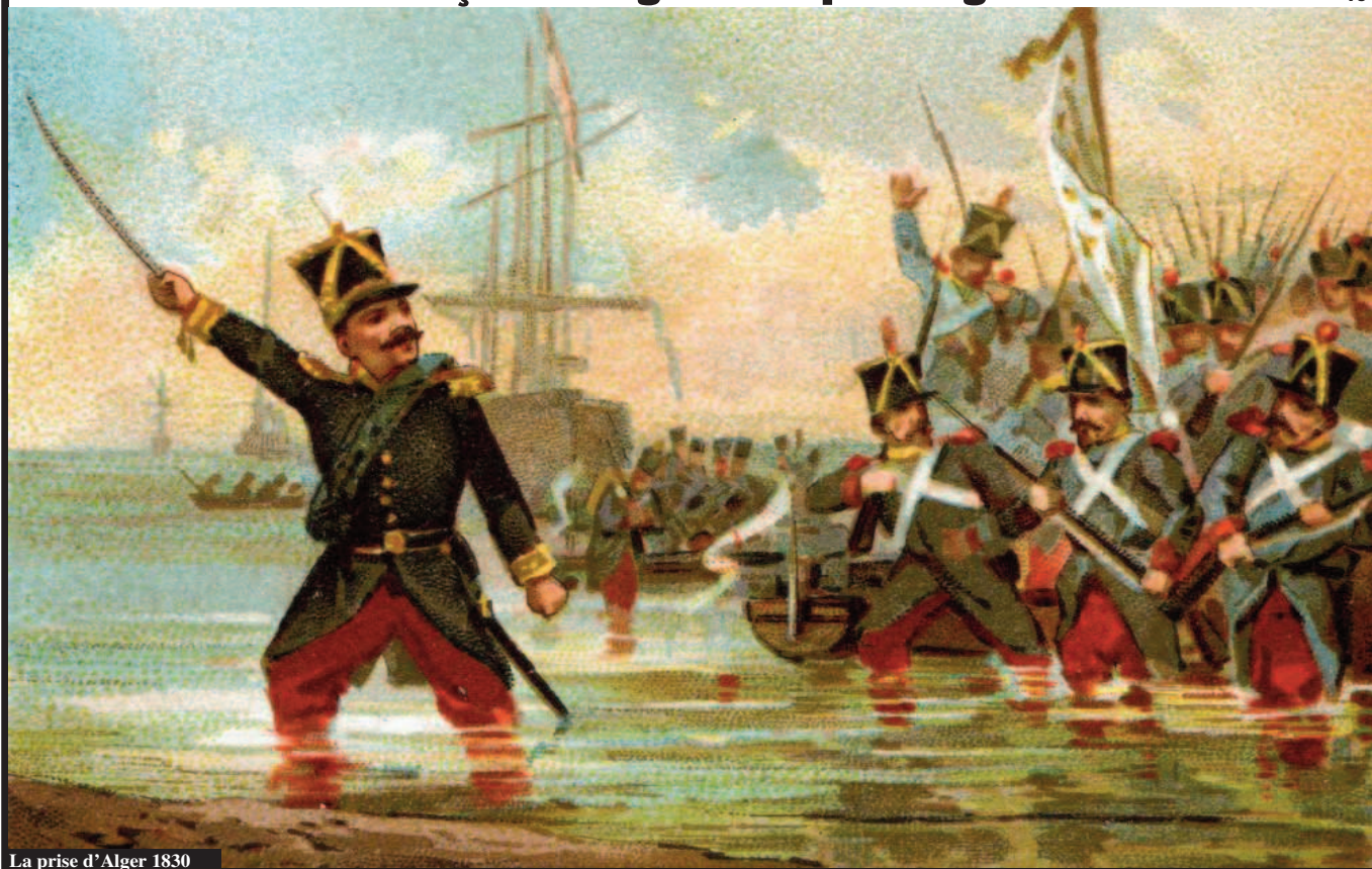
La prise d'Alger 1830