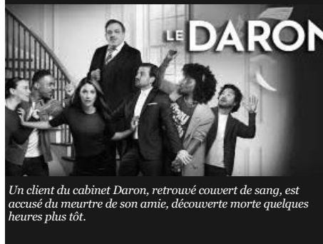
Un client du cabinet Daron, retrouvé couvert de sang, est accusé du meurtre de son amie, découverte morte quelques heures plus tôt.