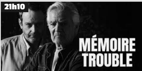
l'ancien commissaire Garlat coule des jours paisibles, loin des tumultes de sa carrière. Mais quand un coup de téléphone vient briser sa quiétude, c'est tout un pan de son passé qui resurgit.