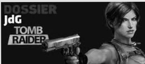
Lara, fille de Lord Richard Croft, un explorateur visionnaire disparu depuis sept ans, elle refuse catégoriquement d'hériter de son empire, préférant vivre de petits boulots et de défis personnels.