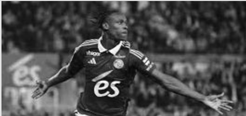
Ligue Conférence. 4e journée. Strasbourg / Crystal Palace.