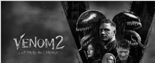
Eddie Brock tente tant bien que mal de reconstruire sa vie, un an après avoir découvert l'existence de Venom, le symbiote extraterrestre qui partage désormais son corps.