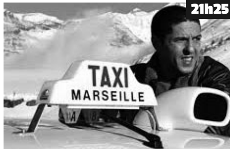
Une bande de malfrats portant des costumes de Père Noël sème la terreur et l'humiliation parmi les forces de l'ordre locales.

Après son Oscar pour "12 Years a Slave" : Lupita Nyong'o a admis avoir reçu des offres de rôles déce- vantes