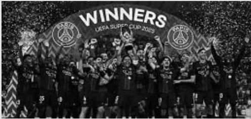
Ligue des champions. 5e journée. Paris-SG / Tottenham.