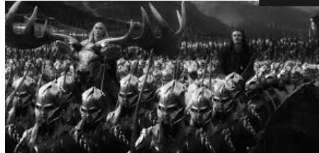
La Terre du Milieu tremble sous les assauts d'une menace ancienne, tandis que les ombres de la guerre s'étendent sur ses terres.