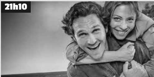
Au cœur d'un musée plongé dans le silence nocturne, un gardien est découvert par sa collègue carbonisée au côté d'une momie, enfermée dans une salle consacrée à l'Égypte antique.