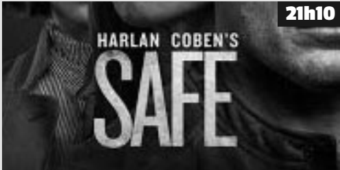
Dans les bas-fonds de New York, où les ombres des gratte-ciel cachent des réseaux criminels impitoyables, deux destins brisés s'apprêtent à se croiser dans une course contre la mort.