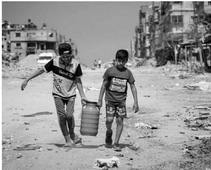
LE BILAN DE L'AGRESSION GRIMPE À 52.567 MARTYRS ET 118.610 BLESSÉS

Le Hamas a appelé à cet égard, la communauté internationale à "ne pas se laisser tromper par les faux récits de l'occupation et à agir immédiatement pour briser complètement le siège et ouvrir les points de passage pour l'acheminement de l'aide alimentaire et médicale, sous la supervision des Nations Unies et loin de toute ingérence militaire ou politique". Il a ajouté que l'occupation sioniste continue d'empêcher l'entrée de l'aide et de perturber le système de distribution humanitaire, ce qui révèle clairement "son intention délibérée de créer une famine", soulignant que l'entité sioniste est entièrement responsable de l'aggravation de la catastrophe humanitaire dans la bande de Gaza.