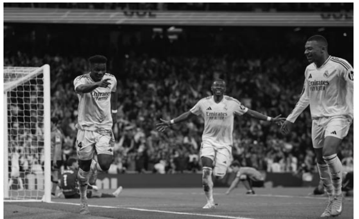
Antonio Rudiger, déjà auteur du tir au but décisif en huitième de finale retour de Ligue des champions face à l'Atlético, a envoyé les Merengues en finale d'un coup de casque imparable (115e, 4-4).

Buteur d'une tête rageuse sur corner à la 115e minute, le défenseur allemand Antonio Rudiger a envoyé les Merengues disputer la 41e finale de Coupe de leur histoire, prévue le 26 avril prochain au stade olympique de la Cartuja de Séville. Ils affronteront dans tous les cas l'un de leurs éternels rivaux, le FC Barcelone ou l'Atlético Madrid. Avec sa qualification en main, le Roi d'Europe a cependant fait preuve d'une passivité déconcertante sur un ultime corner adverse à la 93e minute, laissant le capitaine Oyarzabal devancer la sortie tardive d'Andriy Lunin pour envoyer les deux équipes en prolongation (90e+3, 4-3). Entré en jeu pour rassurer sa défense, le roc allemand An-