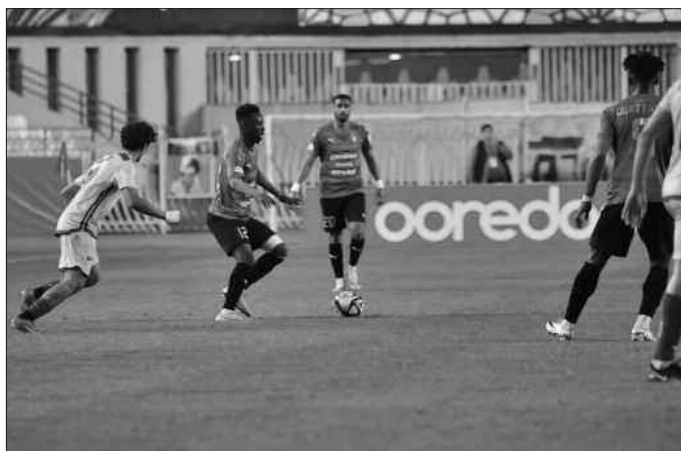
Sud-Africains d'Orlando Pirates (2e - 7 pts) aux Ivoiriens du Stade d'Abidjan (4e - 1 pt).