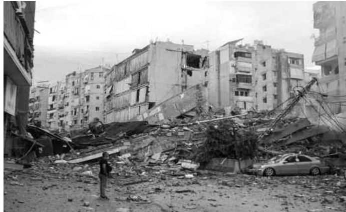
5 ÉTUDIANTES ASPHYXIÉES PAR DU GAZ LACRYMOGÈNE

L'armée d'occupation a perpétré 6 massacres hier, en bombardant des habitations à Beit Lahia (nord) et dans les camps de Nusairat et Bureij (centre), faisant 96 martyrs, plus de 60 blessés, selon un nouveau bilan annoncé par les autorités palestiniennes à Gaza. Un précédent bilan a fait état de 65 martyrs. Dans un communiqué, le bureau des médias palestiniens à Gaza, a expliqué que "l'armée d'occupation a commis 6 massacres barbares au cours des dernières 24 heures, bombardant plusieurs immeubles résidentiels et des bâtiments civils, faisant 72 martyrs parmi les Palestiniens à Beit Lahia". "Deux autres massacres" ont été perpétrés par l'armée d'occupation sioniste dans les camps de Nusairat et Bureij, "suite à des bombardements qui ont fait 24 martyrs palestiniens". Le bureau des médias a également fait état de "15 disparus et 60 blessés", suite à ces massacres. Le bilan de l'agression génocidaire sioniste contre la bande de Gaza depuis le 7 octobre 2023 s'est aggravé à 43.799 martyrs et 103.601 blessés, ont indiqué samedi les autorités palestiniennes de la santé.