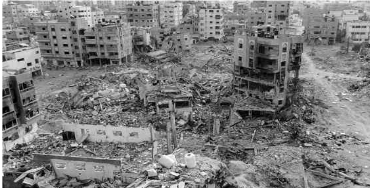
PLUS DE 3.000 MASSACRES PERPÉTRÉS DEPUIS LE 7 OCTOBRE 2023

"Je condamne les attaques continues contre les civils. La guerre doit cesser (...), les civils doivent être protégés où qu'ils se trouvent. L'aide humanitaire doit être fournie sans entrave", a ajouté le représentant de l'ONU.