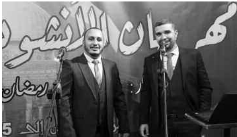
Lors de cette soirée, qui s'est déroulée au Palais des expositions (Safex), les troupes de chant religieux "Hamamet Es'salam" de Bordj El Bahri, dans la catégorie des moins de 16 ans, et "Ranim Al Wissal",

Sous le thème "Durant le Ramadan... Nous chantons pour la Palestine", cet événement a rassemblé plus de 120 troupes de chants religieux composées de professionnels aguerris et d'amateurs passionnés, dans une célébration du talent et de la spiritualité. Les troupes de chant religieux "Hamamet Es'salam" et "Ranim Al Wissal" ont décroché le bouclier d'or du 4e Festival du chant religieux pour jeunes de la wilaya d'Alger, qui s'est clôturé vendredi soir. La soirée de clôture de cette quatrième édition, organisée par la Direction de la jeunesse et des sports de la wilaya d'Alger, a été dédiée à la Palestine, en signe de solidarité avec le peuple palestinien.