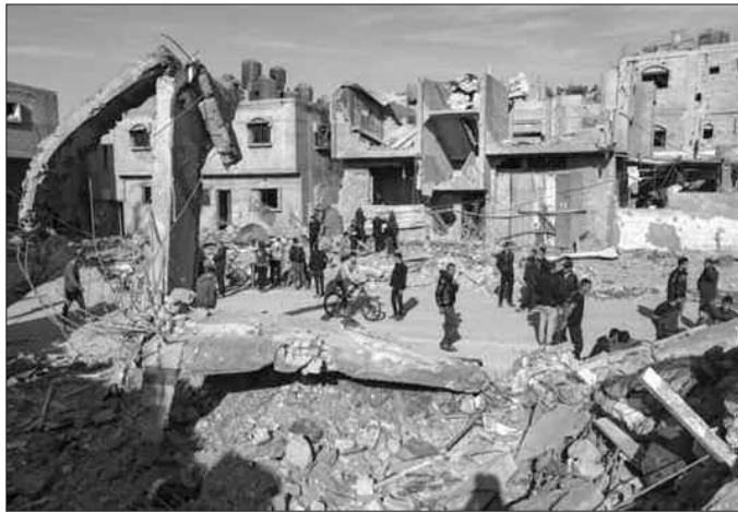
RISQUE D'UNE EXPLOSION DU NOMBRE DE DÉCÈS ÉVITABLES D'ENFANTS À GHAZA

Les agences humanitaires ont précisé que les cas signalés jusqu'à présent "ne donnent qu'un aperçu limité de l'ampleur de la catastrophe sanitaire".