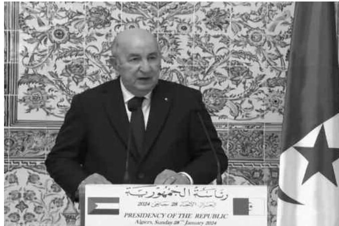
et la quiétude des peuples" A cette occasion, le président de la République a affirmé "la convergence des vues de l'Algérie et du

Le président Tebboune s'est dit convaincu que le Soudan "saura surmonter cette épreuve induite par un acharnement éhonté à son encontre". Par ailleurs, le président de la République a rappelé les relations fraternelles "séculaires fondées sur les liens de coopération étroite et le respect mutuel" unissant les deux peuples, algérien et soudanais, saluant la position du Soudan qui "soutient l'Algérie en sa qualité de membre du Conseil de sécurité de l'ONU". Il a réaffirmé que l'Algérie "œuvrera durant son mandat au sein du Conseil de sécurité à soutenir les causes justes dans le continent africain et à travers le monde et à endiguer les conflits et tensions qui constituent désormais une menace pour la stabilité des Etats