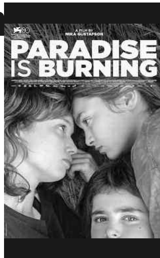
Brindacier. Les Guldbagge Awards ont été introduits pour la première fois en 1964, il n'y avait que trois catégories. En 2011, sept nouveaux prix Guldbagge ont été décernés. La nouveauté 2016 est le prix du meilleur nouveau film.