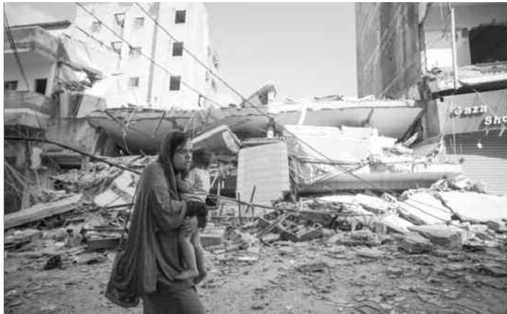
GUTERRES : LE MONDE RESTE LES BRAS CROISÉS ALORS QUE DES FEMMES ET DES ENFANTS, SONT TUÉS

L'agence de presse palestinienne a ajouté que l'armée d'occupation sioniste a emmené les corps d'autres jeunes hommes avant de se retirer. Des témoins oculaires ont déclaré que l'armée d'occupation sioniste a fait incursion dans le camp de Balata à l'aube, avec un grand nombre de véhicules militaires et un bulldozer, attaqué plusieurs maisons et procédé à la destruction de rues et de propriétés dans le camp et ses environs. Des affrontements ont éclaté entre des dizaines de Palestiniens et l'armée sioniste, au cours desquels cette dernière a utilisé des balles réelles et métalliques et des bombes lacrymogènes, a-t-on ajouté.