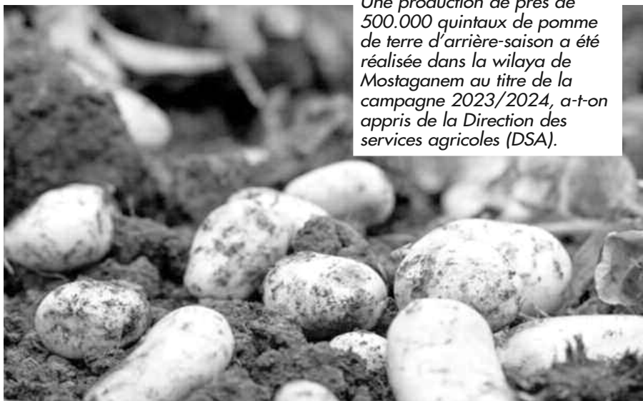
Une production de près de 500.000 quintaux de pomme de terre d'arrière-saison a été réalisée dans la wilaya de Mostaganem au titre de la campagne 2023/2024, a-t-on appris de la Direction des services agricoles (DSA).

Le service de régulation de la production et de l'appui technique, relevant de la même direction, a précisé qu'un volume de production de ce produit agricole estimé à 478.000 quintaux a été engrangé à l'issue de la campagne de récolte, qui a ciblé une superficie globale évaluée à 2.175 hectares consacrée à ce tubercule. La DSA a fait observer qu'en dépit de la réalisation d'un rendement moyen de 222 quintaux à l'hectare, jugé inférieur aux objectifs prévisionnels fixés à 250 quintaux à