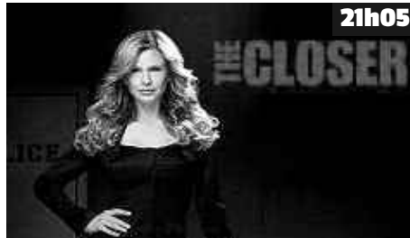
21h05 Provenza découvre le cadavre d'un dealer dans la baignoire d'une hôtesse de l'air qu'il a rencontrée lors d'un vol.