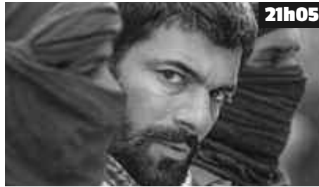
21h05 Ray Breslin est un spécialiste de l'évasion. Pour sa société, il teste les prisons de haute sécurité. C'est dans ce cadre qu'il se retrouve, à la demande de la CIA.