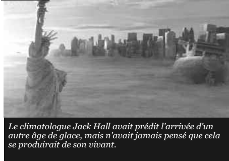
21h25 Le climatologue Jack Hall avait prédit l'arrivée d'un autre âge de glace, mais n'avait jamais pensé que cela se produirait de son vivant.