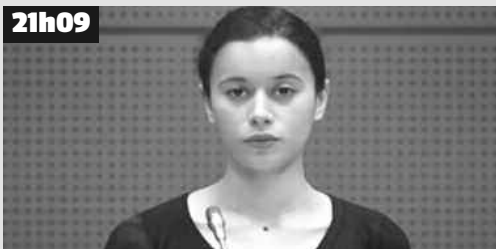
21h09 Après les meurtres de plusieurs internautes, Bullit et Ripper comprennent que le tueur s'en prend aux personnes qui ont poussé au suicide Emilie Tyler, une youtubeuse célèbre.