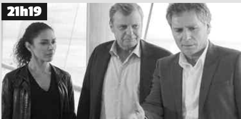
21h19 Frank a été retrouvé assassiné dans son bureau. Son coffret a été vidé, il s'agirait à première vue d'un cambriolage qui a mal tourné.