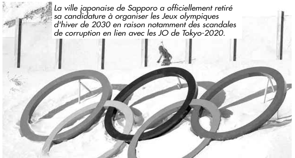
La ville japonaise de Sapporo a officiellement retiré sa candidature à organiser les Jeux olympiques d'hiver de 2030 en raison notamment des scandales de corruption en lien avec les JO de Tokyo-2020.

À la place, Sapporo envisage une candidature pour les JO d'hiver de 2034 ou au-delà : la ville va continuer d'explorer "la possibilité" d'organiser ses deuxièmes JO d'hiver (après ceux de 1972) et ses premiers Jeux paralympiques d'hiver, a déclaré son maire Katsuhiko Akimoto lors d'une conférence de presse. La capitale de la grande île de Hokkaido est "riche en neige naturelle", elle a "l'expérience"