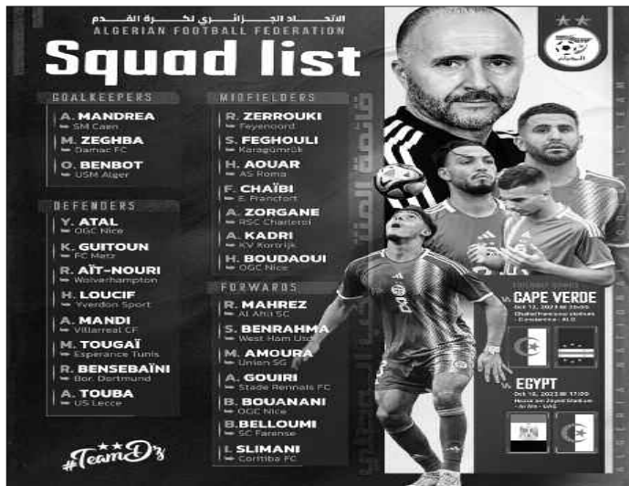
(Courtraï/ Belgique) Attaquants : Mahrez (Al-Ahly/ Arabie Saoudite), Slimani (Coritiba FC/ Brésil), Bouanani (OGC Nice/ France), Ben-rahma (West Ham/ Angleterre), Amoura (Union Saint-Gilloise/ Belgique), Belloumi (Farense SC/ Portugal), Gouiri (Stade Rennais/ France).