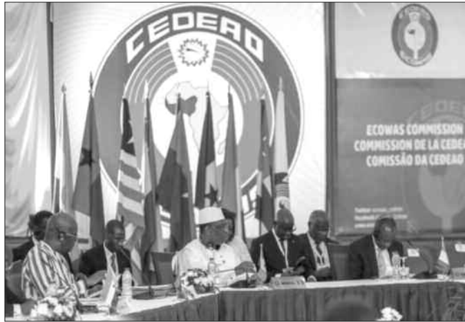
"Il n'est plus temps pour nous d'envoyer des signaux d'alarme", a-t-il déclaré. "Le temps est à l'action". Les pays de la Cédéao étaient représentés par leur dirigeant ou leur représentant.

D'autres sanctions financières ont été décidées, notamment "un gel des avoirs" pour ceux qui retiennent le président Bazoum et sa famille depuis mercredi dernier. A l'ouverture du sommet, le président nigérien Bola Tinubu, à la tête de la Cédéao, a dénoncé "la prise d'otage" du président Bazoum par des membres de sa garde présidentielle et l'"assaut" fait à la démocratie.