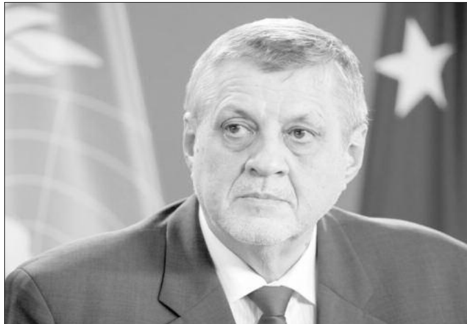
LA RUSSIE APPELLE À LA "RETENUE MAXIMALE"