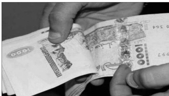
sions de la loi de Finances complémentaire 2021.

Selon lui, un comité sera chargé de définir les modalités de la création d'un "système de compensation monétaire au profit des véritables bénéficiaires". Ce travail, a-t-il précisé, s'effectuera sur la base d'une étude approfondie en cours depuis plusieurs années qui cherche à définir les ménages éligibles. Plusieurs départements ministériels, notamment les ministères de l'Intérieur, des Finances et de la Solidarité nationale, ainsi que l'Office national des statistiques s'attellent à cette tâche, a-t-il annoncé. Une task force créée en 2006 et élargie cette année aux représentants du Conseil de la nation avant d'inclure, plus tard, tous les experts et les députés de l'Assemblée populaire nationale. Le responsable de l'Exécutif en a outre souligné que la valeur des transferts sociaux au titre de l'exercice 2022 s'élèvera à 1.942 milliards DA, soit 8,4% du produit intérieur brut, avec une baisse de 19 % par rapport aux prévi-