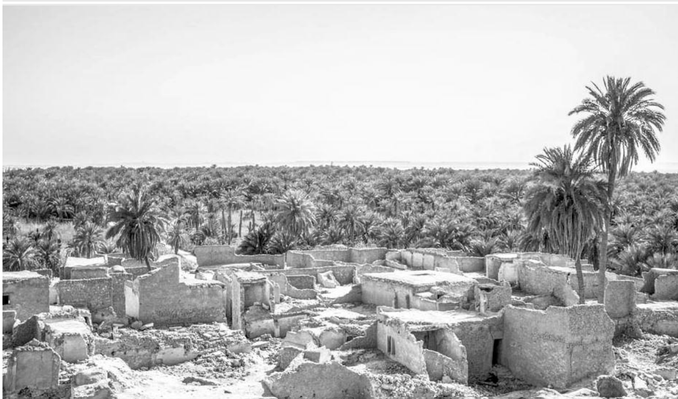
DAÏRA DE N'GOUSSA (OUARGLA)