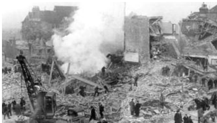
Le 10 novembre 1944, l'armée allemande du IIIème Reich bombarde la Grande-Bretagne avec ses fusées V2 ?