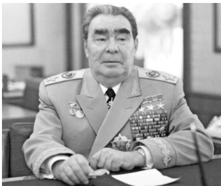
Le 10 novembre 1982, à 75 ans, le premier secrétaire du parti communiste de l'Union soviétique, Leonid Brejnev meurt.