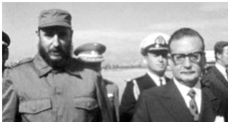
Le 10 novembre 1971, le président cubain, Fidel Castro, fait une visite de 1 mois au Chili pour rencontrer le président socialiste Salvador Allende.