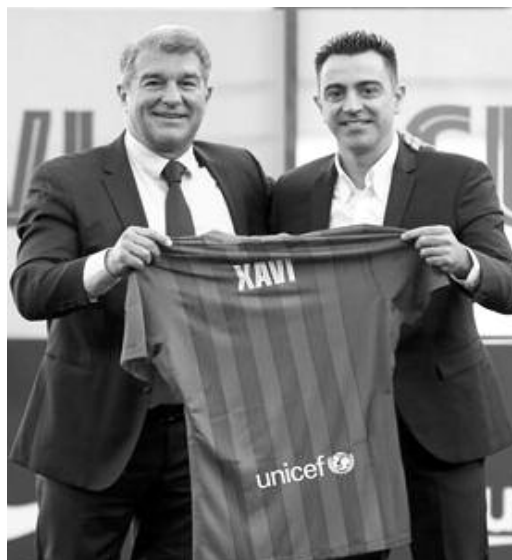
Pour le premier match de son nouvel entraîneur, le Barça affrontera l'Espanyol Barcelone pour un derby le 20 novembre

"Je connais le club, les joueurs, l'entourage du club, il y aura des critiques", a estimé Xavi. "C'est le club le plus difficile du monde car il faut bien jouer et gagner, il faut convaincre."