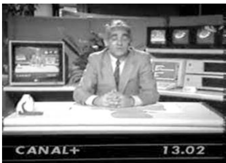
Le 4 novembre 1984, ouverture officielle d'une chaîne de télévision payante, en France : CANAL+