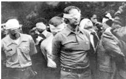
Le 4 novembre 1979, à Téhéran (Iran) lors de la révolution islamique, l'ambassade des États-Unis est attaquée et 90 Américains sont pris en otage..