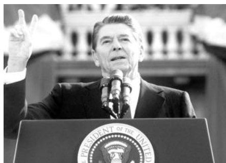
Le 4 novembre 1980, Ronald Reagan (ex-acteur de cinéma) est élu 40ème président des États-Unis, il bat le président sortant, Jimmy Carter.