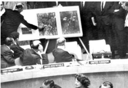
Le 25 octobre 1962, avec l'installation de missiles à Cuba par l'URSS, poussant à l'extrême la crise avec les États-Unis, le monde est passé à deux doigts d'une guerre nucléaire.