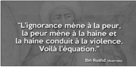
Ibn Rushd (Averroès)