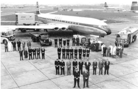
Le 25 octobre 1949, le premier avion à réaction civile, pour le transport de passager, le De Havilland Comet réalise son premier vol d'essai. Un trajet Londres / Tripoli aller/retour en 6h36.