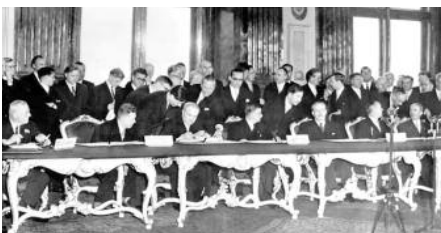
Le 25 octobre 1955, l'Autriche retrouve son indépendance avec le départ des troupes alliées stationnées dans son pays depuis la fin de la guerre. L'Autriche avait perdu son indépendance en mars 1938 avec l'Anschluss, son annexion par l'Allemagne nazie.