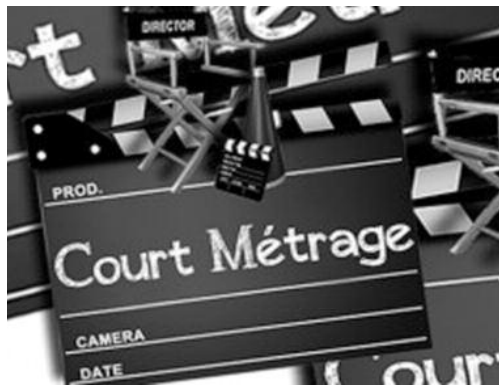
Des appels à participation à ces journées cinématographiques ont été lancés à travers les différents réseaux officiels et sociaux, pour permettre au comité de présélection de faire le