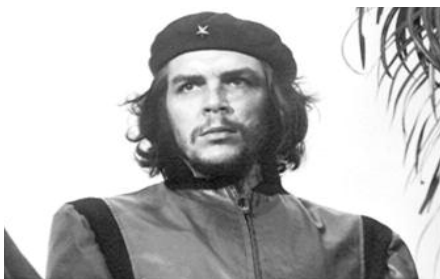
Figure emblématique de l'action révolutionnaire armée pendant la Guerre froide, le Che Guevara trouve la mort dans le maquis bolivien le 10 octobre 1967, à l'âge de 39 ans.

Ernesto Guevara dans les années 1960 avec sa femme et trois de ses enfants. Figure mythique de l'action révolutionnaire armée durant la Guerre froide, le « Che » est tué en Bolivie le 10 octobre 1967.