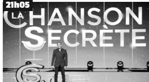
Se laisser surprendre, émuouvoir, voici ce qui attend les huit artistes qui n'ont aucune idée de ce qui va se passer pour eux.