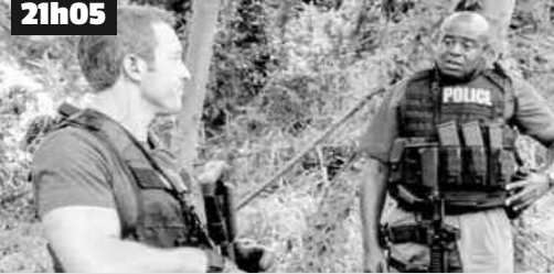
L'équipe de Steve enquête sur la mort d'un agent de nettoyage. L'affaire prend rapidement un tournant inquiétant.