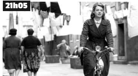
L'équipe de Steve enquête sur la mort d'un agent de nettoyage. L'affaire prend rapidement un tournant inquiétant.