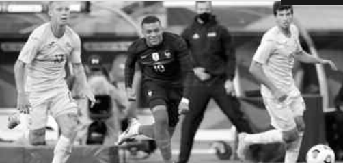
Football. Éliminatoires de la Coupe du Monde 2022. Groupe D.