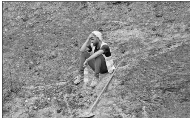
UNE AUTRE CALAMITÉ

Pour la première fois, c'est la population et la société civile qui ont suppléé les dysfonctionnements de l'administration. Sans attendre une action des pouvoirs publics, les familles se sont organisées pour acquiescer par elles-mêmes ce dont leurs patients avaient besoin.