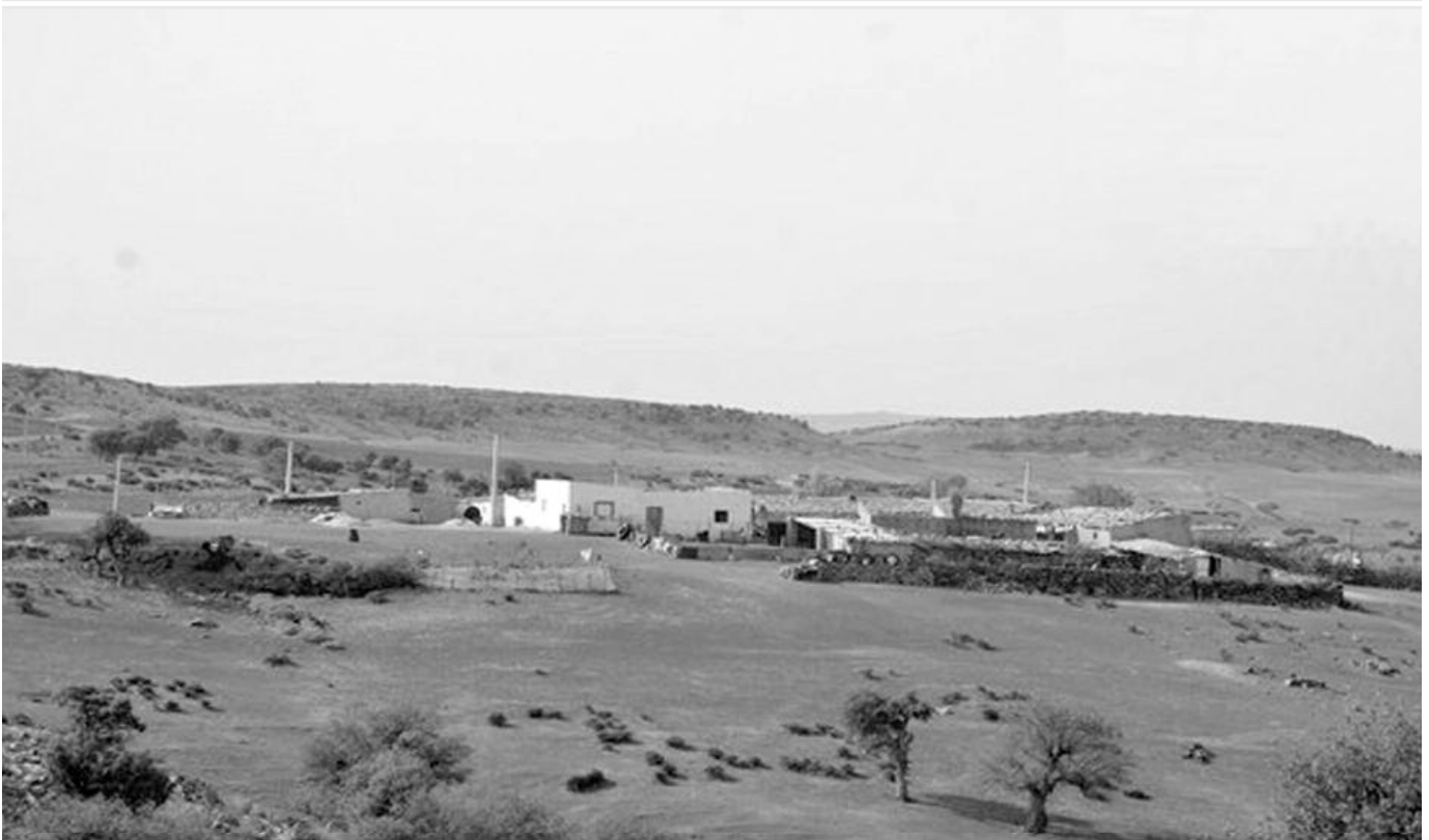
SAIDA (ZONES RURALES)