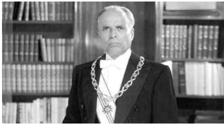
3 août 1903 à Monastir (Tunisie) - 6 avril 2000 à Monastir (Tunisie)