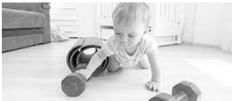
s'attendre », souligne Herman Pontzer.

À leur naissance, les bébés ont le même taux métabolique que leur mère. Mais dès l'âge de 9 mois, ce dernier augmente rapidement jusqu'à brûler 50 % de calories en plus jusqu'à 15 mois. « Et ce n'est pas seulement parce que les nourrissons triplent leur poids sur cette période. Bien sûr, ils grandissent, mais même en éliminant cette variable, leur dépense énergétique augmente bien plus que ce à quoi on pourrait