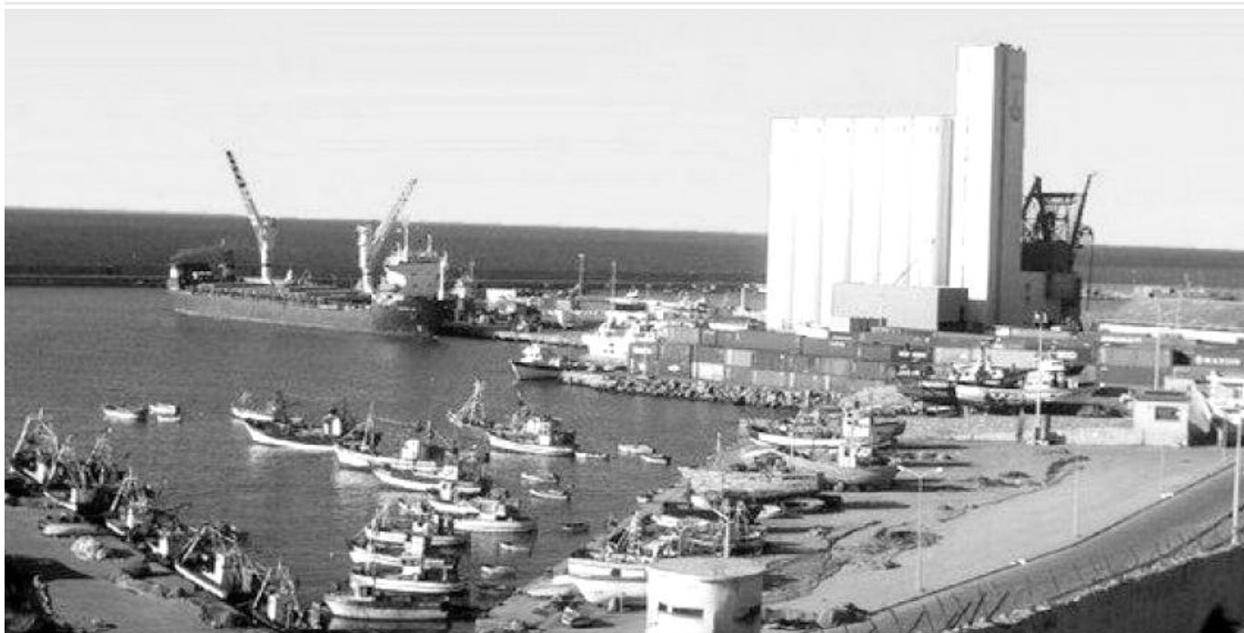
PORT DE MOSTAGANEM