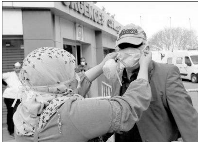
source a indiqué que la majorité représente des cas graves.

Cette dernière, en reconduisant son dispositif spécial covid-19 qu'elle a déjà déployée lors du pic de l'été 2020, estime que la situation épidémique «n'est pas grave, mais inquiétante» d'où l'intérêt d'une mobilisation générale pour préparer à une éventuelle forte hausse des contaminations. A Blida, les deux principaux hôpitaux de Blida, Frantz Fanon et Ibrahim Terchine (ex-faubourg), se trouvent au bord de la saturation. Selon une source médicale locale, le nombre de cas enregistré le seul jour de vendredi était de 158. La même