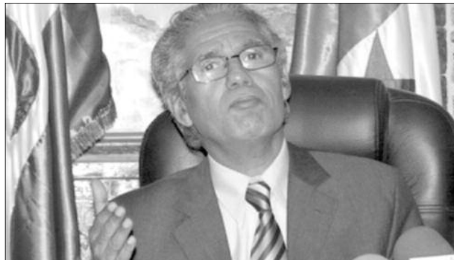
DES SIGNES LAISSANT ENTREVOIR UN CHANGEMENT DE LA POSITION AMÉRICAINE