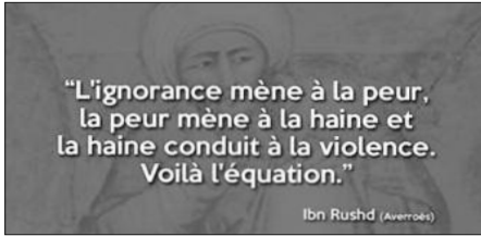
Ibn Rushd (Averroès)