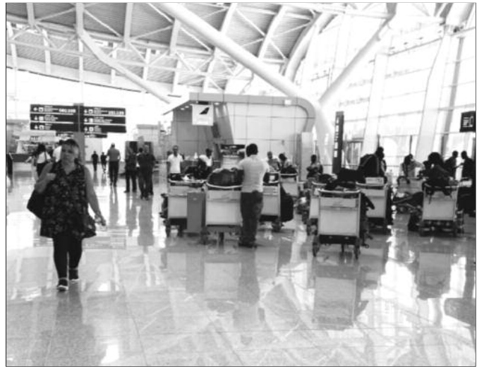
Ali M'nacer, membre de l'association nationale des agences du tourisme et voyage, l'ouverture des frontières ne concerne que le rapatriement de nos ressortissants bloqués à

Autrement dit, les voyageurs algériens qui voudraient partir en vacances vers ces deux destinations ne pourront pas le faire. Air Algérie se réfère aux conditions d'entrée fixées par les autorités françaises et espagnoles disponibles sur les sites de ministère français de l'intérieur ( https://www.interieur.gouv.fr/Actualites/L-actu-du-Ministere/Attestation-de-deplacement-et-de-voilage ) et du site gouvernemental espagnol ( https://www.spth.gob.es/ ). Selon la réglementation en vigueur en France, les voyageurs désirant s'y rendre devront se munir d'une dérogation spéciale en plus des tests, une déclaration sur l'honneur et, cerise sur le gâteau, une mise en quarantaine de sept jours. Il convient de noter que l'Espagne et la France font partie des destinations vers lesquelles se fera la réouverture partielle des frontières à compter d'aujourd'hui, comme décidé par les autorités. Air Algérie va ainsi opérer par semaine, deux vols de et vers Paris-Orly, un vol de et vers Marseille et un vol de et vers Barcelone. Dans son communiqué du 24 mai, le gouvernement a indiqué au sujet des modalités de sortie du territoire national, «les passagers demeurent soumis aux seules conditions édictées par les autorités des pays d'accueil pour leur entrée sur leurs territoires.» Selon