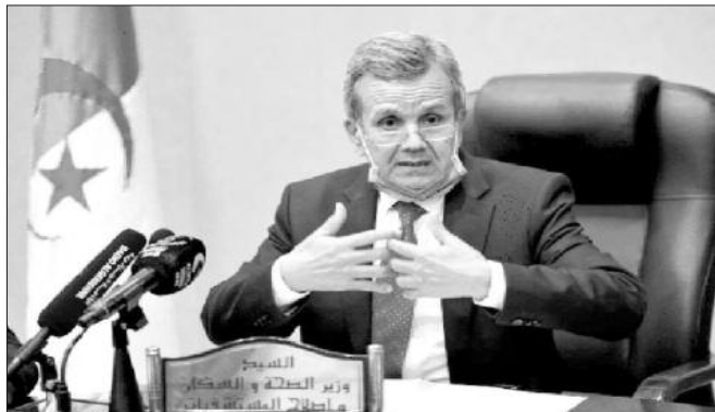
Président de la République".

Le ministre a mis en exergue, à cette occasion, la place qu'occupent les professionnels de la santé, "leurs sacrifices et leur abnégation ont été l'objet d'éloges et de considération de la part des plus hautes autorités du pays et à leur tête le