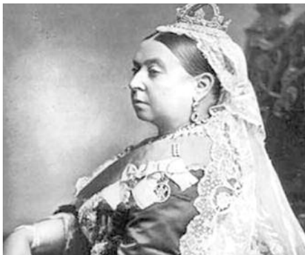
24 mai 1819 à Londres (Angleterre) - 22 janvier 1901 à Osborne (île de Wight, Angleterre)