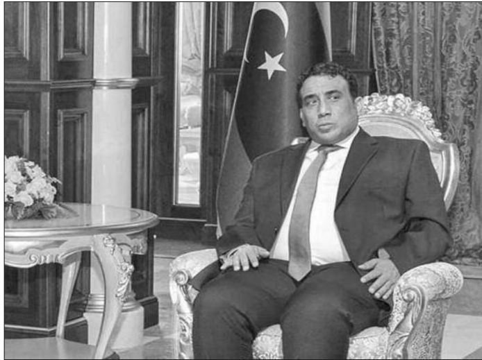
2021 en raison de la présence des forces et mercenaires étrangères", en dépit des "développements positifs qu'a connus la Libye sur les plans politique, économique et sécuritaire ces derniers mois".

L'entretien qui s'est déroulé en présence des deux adjoints du président du Conseil présidentiel, Moussa al-Kouni et Abdellah al-Lafi, a abordé également les relations bilatérales dans les secteurs économique, sécuritaire et militaire. Arrivée lundi à Tripoli, la délégation turque comprenant outre les ministres des Affaires étrangères et de la défense, le chef des renseignements turcs et des officiers supérieurs, s'est entretenue aussi avec le chef du gouvernement libyen, Abdelhamid Dbeibah et la chef de la diplomatie, Nadjia al-Mangouche. Lors d'une conférence de presse animée conjointement avec son homologue turc, Mme al-Mangouche a appelé la Turquie à coopérer avec la Libye pour le retrait des mercenaires étrangers de la Libye. "Nous appelons la Turquie à coopérer avec nous pour mettre fin à la présence de toutes les forces étrangères et des mercenaires afin de préserver la souveraineté" de la Libye, a déclaré Mme al-Mangouche, soulignant "l'importance de la contribution de la Turquie à la cessation des combats et à la stabilisation du cessez-le-feu dans tout le pays". Le service de renseignement américain a affirmé, lundi, dans son rapport annuel sur "les menaces mondiales", que "la situation sécuritaire en Libye risque de devenir incontrôlable à tout moment durant l'année