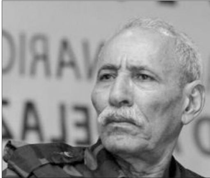
Il a fait observer que "c'est vraiment faire preuve d'indécence que de profiter de ça pour faire chanter l'Espagne sur les dossiers économique, commercial et migratoire", en référence aux agissements de Rabat. Le responsable sahraoui a en outre réaffirmé que le président Ghali "est en bon état de santé,

il va de mieux en mieux". La présidence de la République sahraouie avait déjà indiqué que l'état de santé du président Ghali "n'est pas préoccupant" et qu'il se rétablissait après avoir été infecté par le nouveau coronavirus (Covid-19).