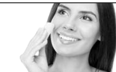
seront votre teint sans l'opprimer. A noter : il existe des produits spécifiques pour les peaux grasses ayant un effet matifiant.

Cacher les imperfections sous des couches de fond de teint n'est pas une bonne astuce. D'un côté, il fait un effet masque pas très joli. De l'autre, il étouffe la peau et incruste les pores. Privilégiez les fonds de teint fluides et légers. Ils uniformi-