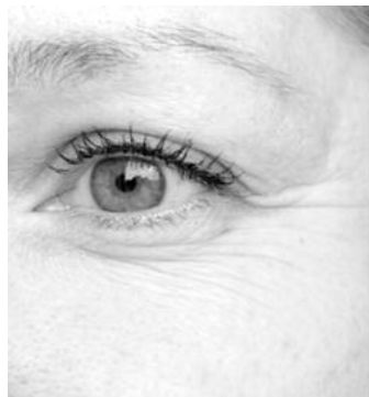
"non seulement l'acide hyaluronique réhydrate, comble ou restaure les volumes, mais il stimule aussi la fabrication de son propre collagène".

Pour ralentir le vieillissement cutané et retarder l'apparition des rides profondes, il est possible de stimuler la production de collagène. Tout d'abord de recourir à l'auto-massage. Pratiquée régulièrement, cette technique permet de relancer la microcirculation et la production d'élastine et de collagène pour un tissu plus tonique. Ensuite, l'experte recommande les injections d'acide hyaluronique :