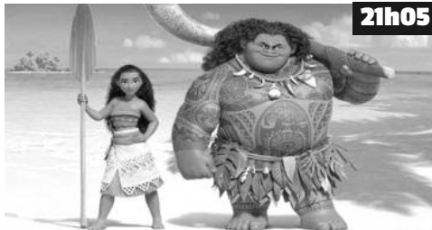
Sur une île de l'Océan pacifique, la très sage Tala raconte à un groupe d'enfants la légende de leur île.