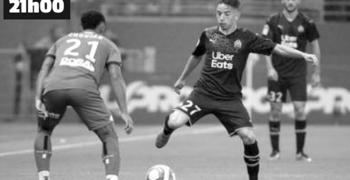
Football. Ligue 1 Uber Eats. 31 e journée.