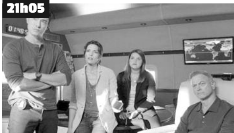
Jack et son équipe se rendent à La Havane pour enquêter sur l'assassinat d'un citoyen américain.

Rose McGowan accuse le patron de Twitter de la censurer pour protéger ses amis démocrates