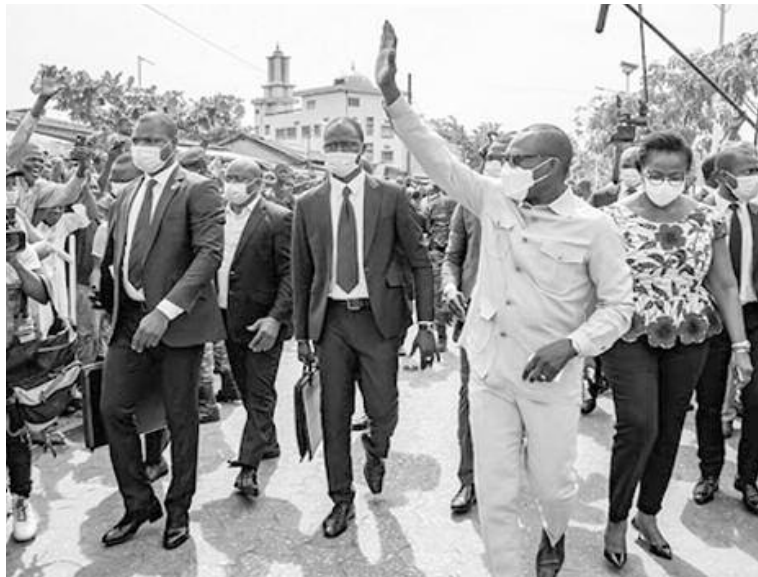
position quasiment inconnus des électeurs et accusés d'avoir été des "faire-valoir" du président Talon, remportent respective-

Ce sont quasiment les mêmes chiffres que ceux fournis mardi soir par la Commission électorale indépendante (CENA) après le décompte des bulletins, qui donnaient le président Talon, 62 ans, vainqueur avec plus de 86% des voix. Alassane Soumanou et Corentin Kohoué, deux candidats de l'op-